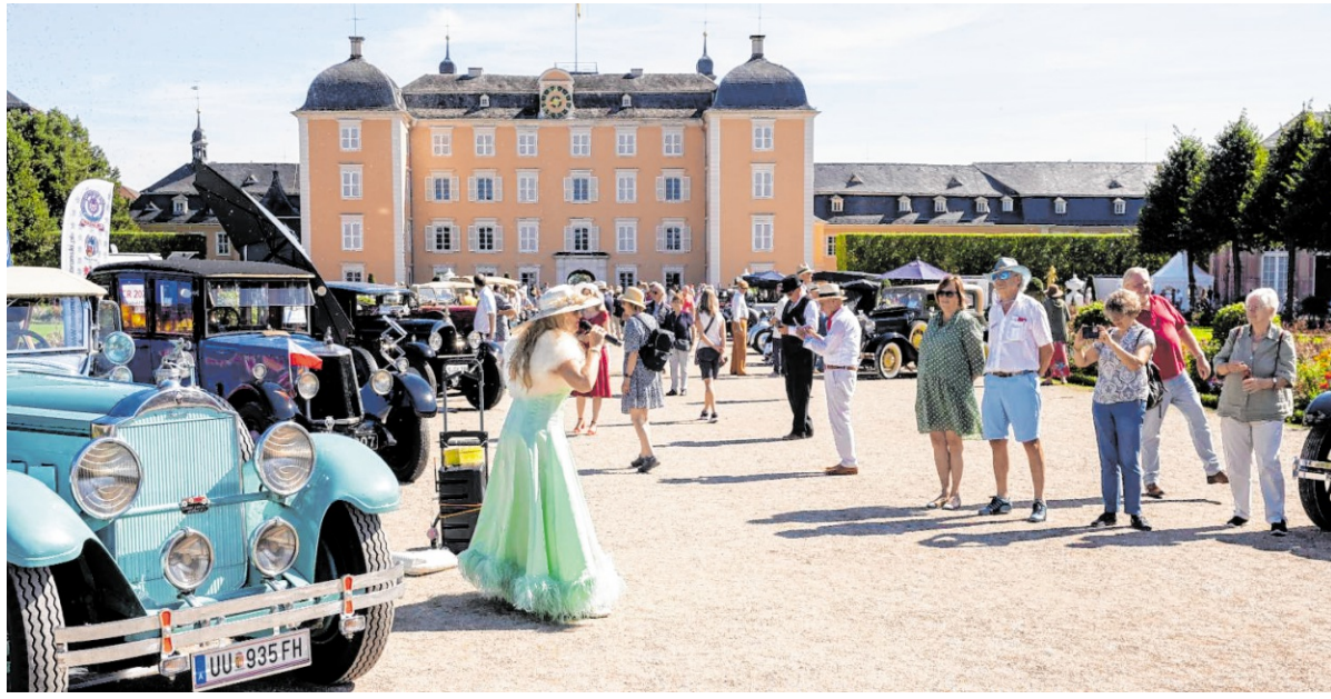
Das Traumwetter lockt viele Besucher in den Schlossgarten. Hier gibt es Chansons passend zur Zeit der Automobile.