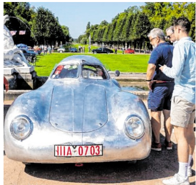
Der „Porsche vor dem Porsche“: Typ 64 Berlin – Rom von 1938/39.