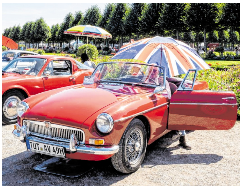
Adi Viesel aus Drossingen betätigt sich als „Schirmherr“ für sich und seinen MG. Die Sonne brennt am Wochenende im Schlossgarten Schwetzingen.