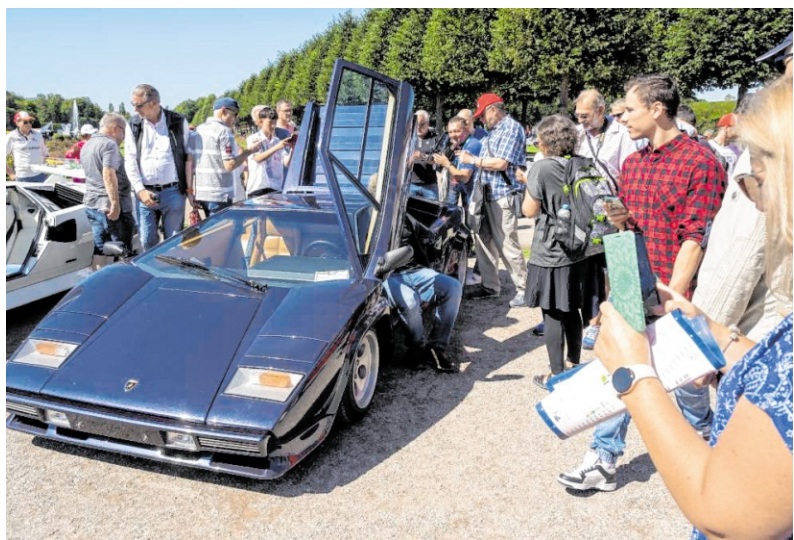
Der „Lambo“ wird dieses Jahr 60. Dazu gibt es eine Sonderschau. Gerade beeindruckt der Besitzer dieses Lamborghini LP 400 S mit einer Hörprobe des Motorsounds.