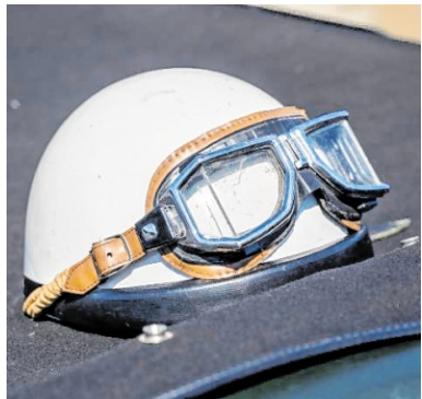
Der Helm liegt auf einem Sunbeam Open Sports Tourer von 1927.