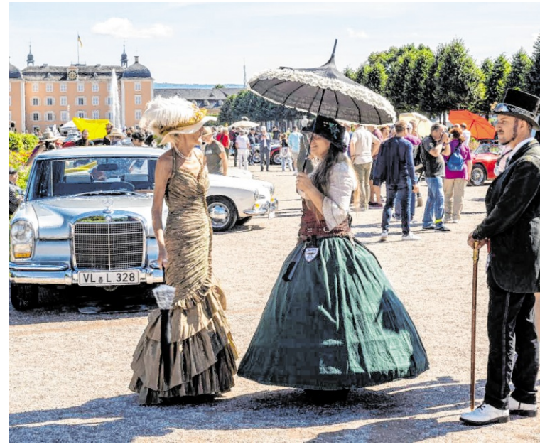
Damen und Herren kleiden sich, wie es in der Epoche ihrer Autos üblich war.